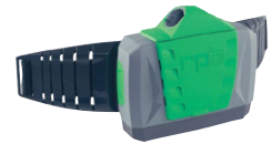
Filter with Batteries