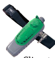
Climate Control Devices