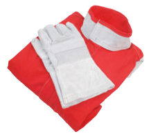
Φόρμα & γάντια